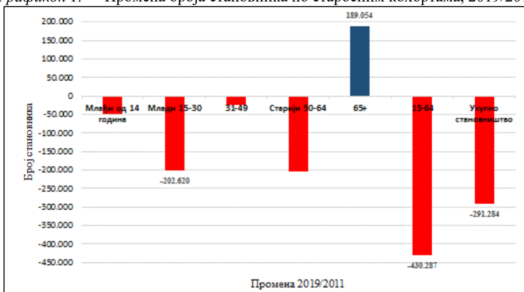
Графикон 1. Промена броја становника по старосним кохортама, 2019/2011

Изразит депопулациони тренд је карактеристика демографских кретања у Републици Србији у последњој, али и претходној деценији. Број становника смањен је за нешто више од 291 хиљаде лица у 2019. години 5 у односу на податке Пописа из 2011. године. Демографска транзиција нарочито утиче на смањење становништва радног узраста (становништво 15–64, смањење за око 430 хиљада лица), посебно кохорте младих у овој категорији становништва (млади 15–30, смањење од 202,6 хиљада лица).