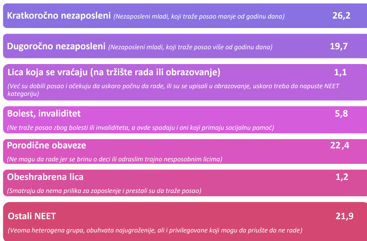
Grafikon 1. NEET mladi u RS prema podgrupama, 2020. godina

U 2020. godini, preko 26% mladih bilo je kratkoročno nezaposleno, dok je 19,7% bilo nezaposleno duže od jedne godine. Među neaktivnim NEET mladima preovlađuju oni koji su odvojeni od tržišta rada zbog staranja o drugima i porodičnih obaveza (22,4% ukupne NEET populacije) i iz drugih, neutvrđenih razloga (21,9%). Mladi koji nisu angažovani na tržištu rada zbog bolesti ili invaliditeta činili su 5,8% ukupnog broja (13.100) u 2020. godini.