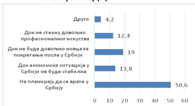
Графикон 4. Планирана дужина боравка у иностранству (%)

На питање о планираној дужини боравка у иностранству студенти су наводили и друге одговоре, нпр.: док не стекну услов за пензију, док не оснују породицу, док им одговара, у зависности од тога како се снађу у иностранству и друго.