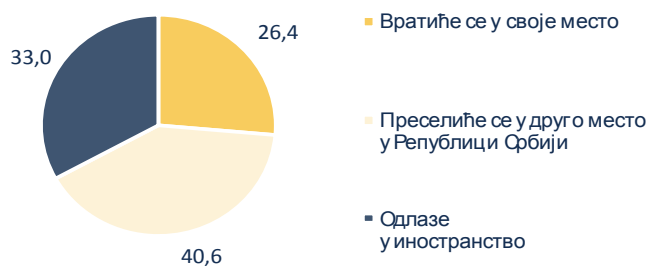
Графикон 3. Планови студената који студирају ван свог места становања (%)

Ако се има у виду чињеница да студенти који се школују изван свог места становања углавном долазе из руралних или из мањих урбаних општина у универзитетске центре у којима, ако се не одлуче за одлазак у иностранство, планирају и да остану да живе након завршетка студија, јасно је да ће се и у наредном периоду наставити демографско пражњење мање развијених подручја Републике Србије.